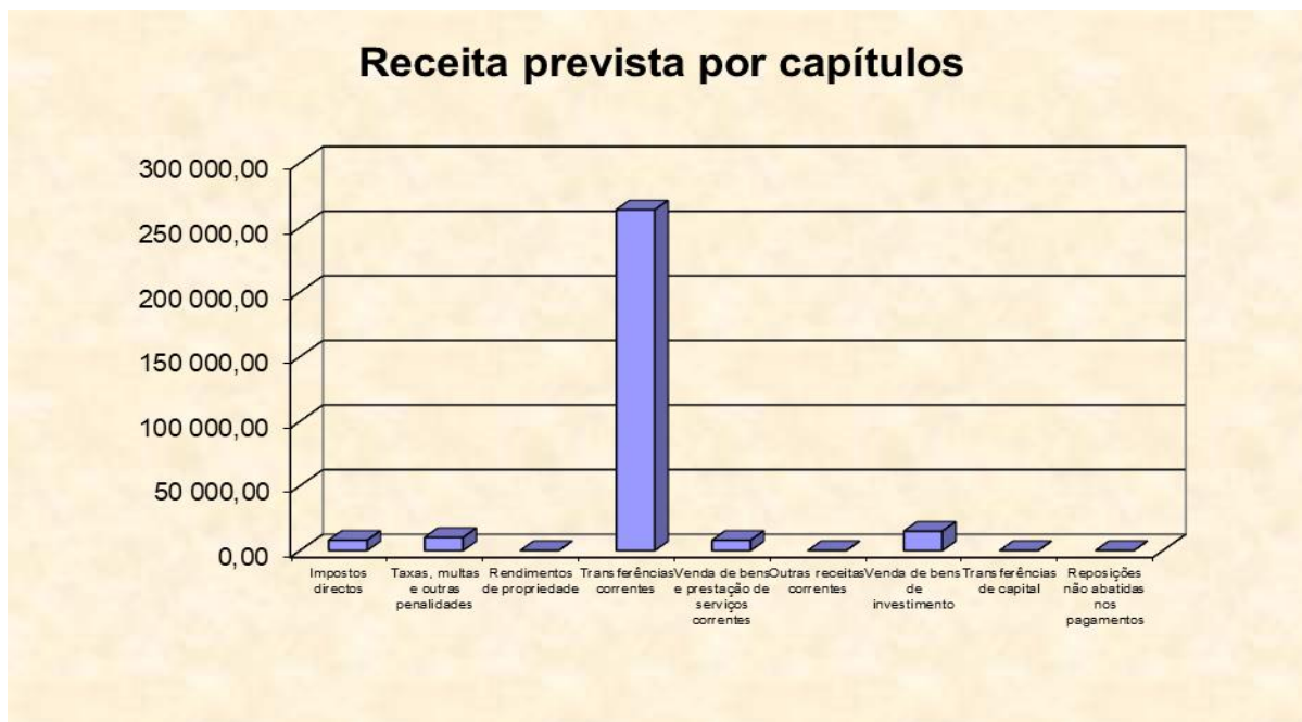
Gráfico n.º 1